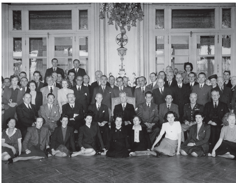
Pripremni odbor stručnjaka u cilju osnivanja Svjetske zdravstvene organizacije, Pariz, 1946.

Prije 75 godina, 1948. godine, zemlje svijeta udružile su se i osnovale Svjetsku zdravstvenu organizaciju kako bi promovale zdravlje, očuvale svijet sigurnim i služile ranjivima, tako da svatko, svugdje može postići najvišu moguću razinu zdravlja. Ova sedamdeset i peta obljetnica postojanja Svjetske zdravstvene organizacije prilika je da se osvrnemo na uspjehe javnog zdravstva koji su poboljšali kvalitetu života te nam mogu služiti kao poticaj za buduće djelovanje i rješavanje svih novih zdravstvenih izazova.